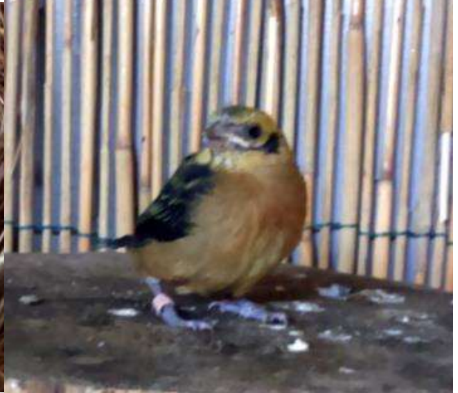
Linksboven; een jonge Goudtangara in het nest.