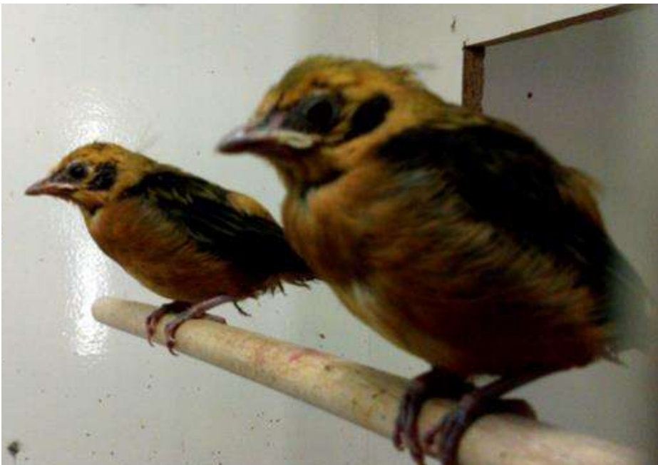
Links; 2 uitgevlogen jonge Goudtangara's.